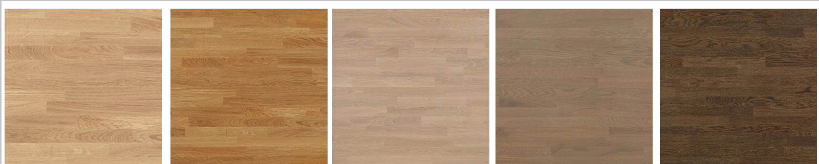
Dąb Surowy (naturalny)